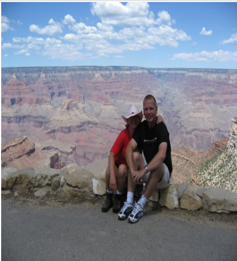
En velfortjent pause under Grand Canyons sol