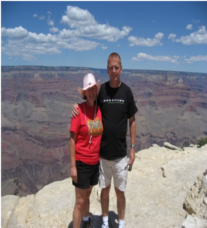
Lone blev modigere!