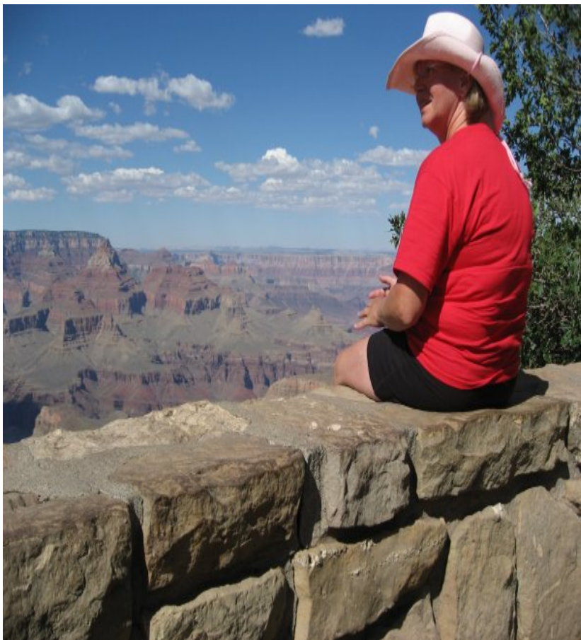
Michael ville ikke stå tilbage.