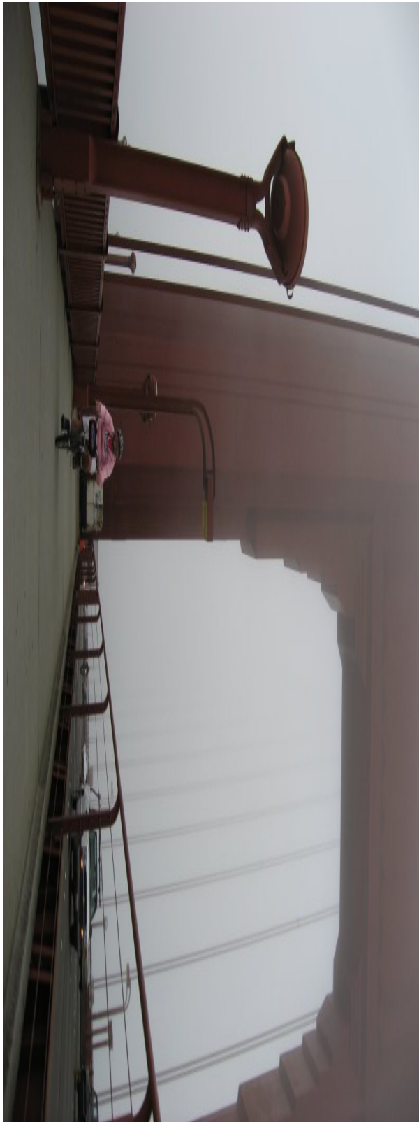
Lone på vej over Golden Gate!

Inde ved Fisherman's Wharf igen, kørte vi lige forbi Pier 33, hvorfra vi skal med båden i aften for at komme til Alcatraz. Vi fik bevis for at det er godt vi havde bestilt biletter hjemmefra. Første ledige tur er på tirsdag!