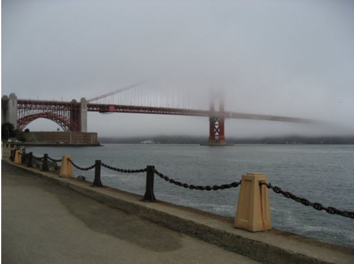
Golden Gate var indhylet i tåge.

I dag har vi været ude at cykle her i San Fransisco. Efter morgenmaden, som vi spiste på hotellet, gik vi ned på havneområdet for at leje cykler. Vi fik en grundig instruktion i hvor vi kunne cykle, fik cyklerne justeret ind, så de passede os, og så var det ellers afsted mod Golden Gate! Vi kørte langs med havneområdet hvor der på meget af turen hen mod broen, var stier vi kunne køre på, så vi slap for at køre mellem bilerne. Det er helt tydeligt at her cykler mange flere end vi har set i andre amerikanske byer, også de lokale. Der er også cykelstier flere steder. I San Diego har vi praktisk talt ikke set cykelister. Man kan leje cykler dernede, med der er ingen lokale der cykler! Vi kunne også se at mange af de turister der havde lejet cykel her i San Fransisco, ikke havde samme rutine i at cykle, som vi har i Danmark.