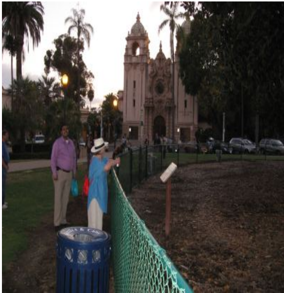
Lone i Balbao Park, uden for San Diego Natural History Museum, The "NAT".