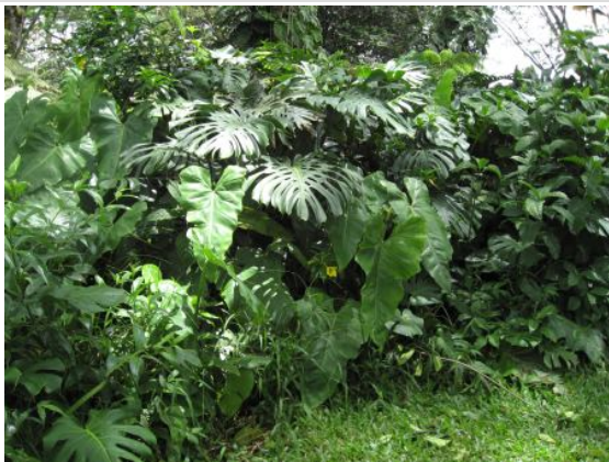
Denne plante som mange kender som stueplante, så vi mange af. Nogle af dem var kæmpestore.