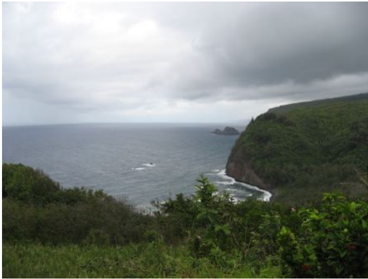
Udsigt ned mod vandet fra Pololu Valley udsigtspunktet.