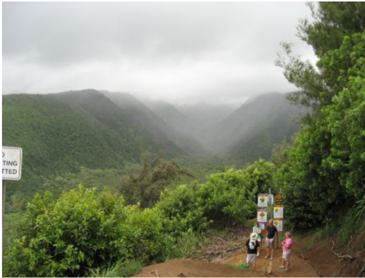
Udsigt ned mod dalen fra Pololu Valley udsigtspunktet.

Så var det tid at køre tilbage. Fordi klokken var blevet mange, valgte vi den samme vej tilbage til Kailua Kona, som vi var kørt ud. Vi var hjemme ved hotellet lidt i syv. Nåede lige at se solen gå ned, mens vi sad og spiste vores aftensmad.