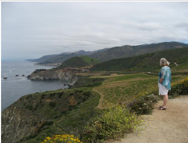
Kone nyder udsigten.