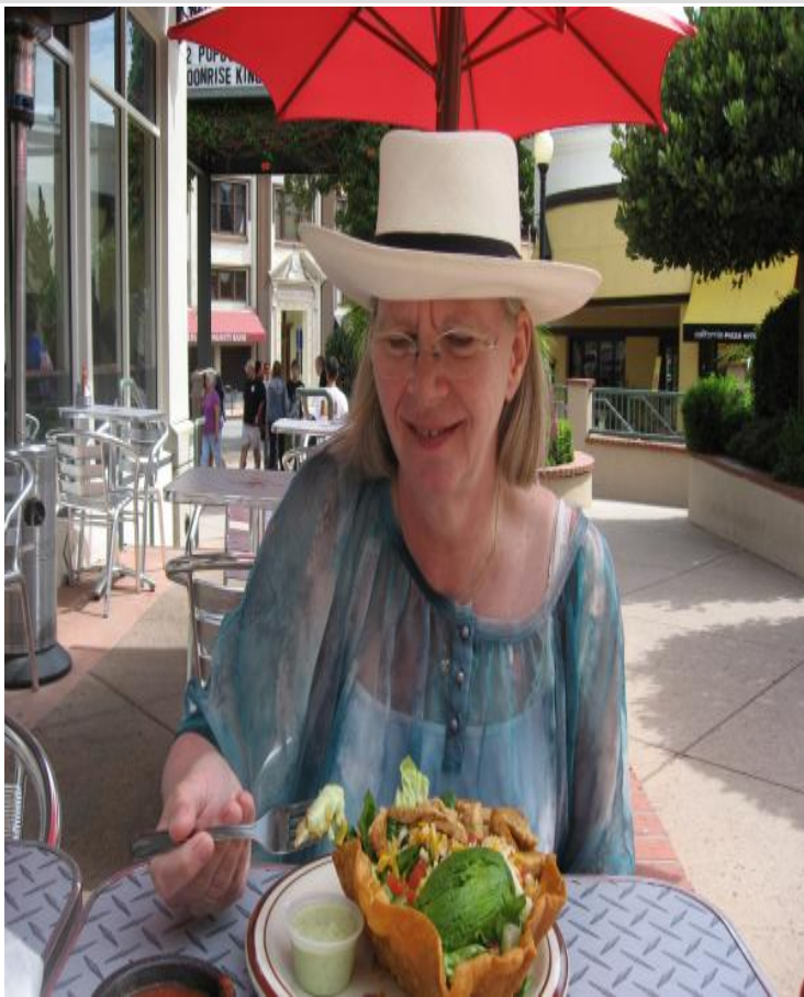
Lone spiser frokost.