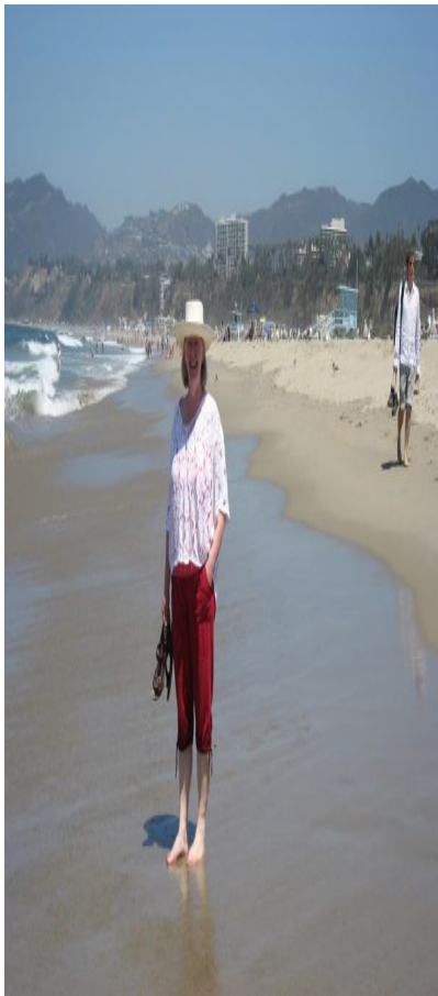
Lone på Santa Monica Pier. Ser på den flotte udsigt.